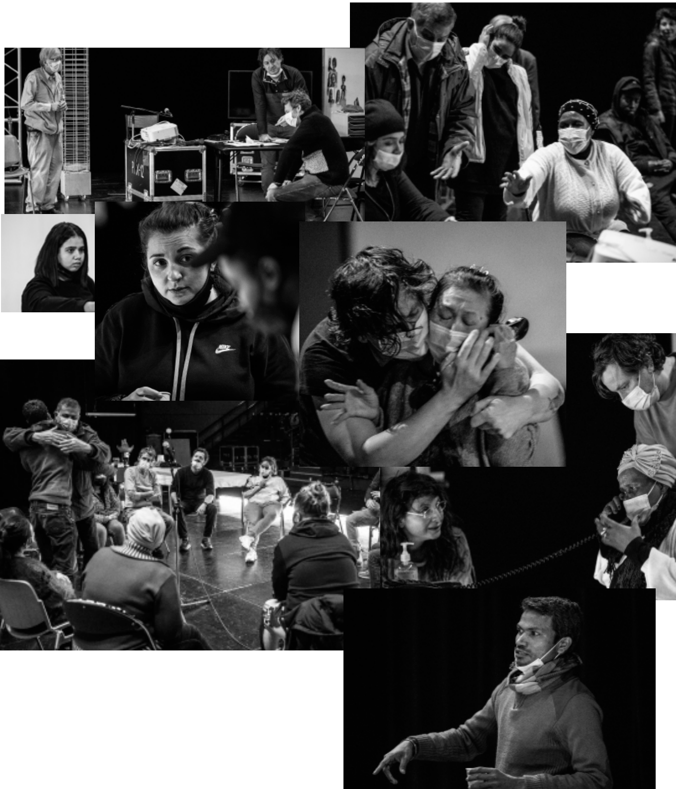
Répétitions au Théâtre National de Bretagne, janvier 2021