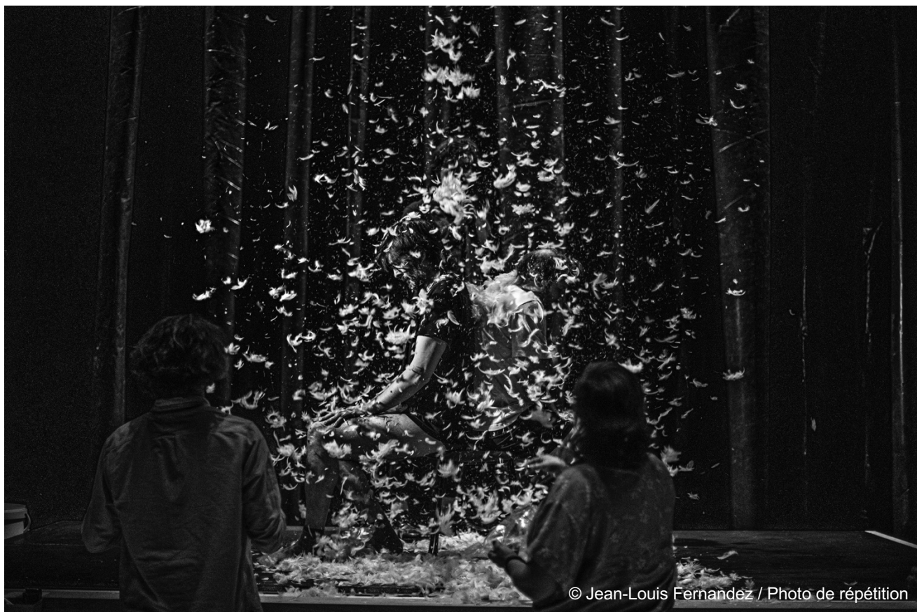
© Jean-Louis Fernandez / Photo de répétition

Soutien en résidence Théâtre de la Ville – Paris ; Le Volcan, scène nationale du Havre ; Cromot, Maison d'artistes et de production