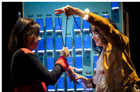
Le Motel des destins croisés