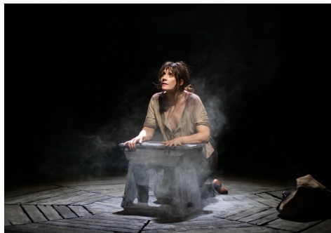
Le Procès de Jeanne